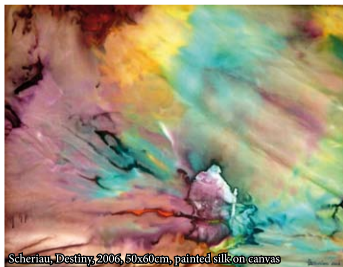
Scheriau, Destiny, 2006, 50x60cm, painted silk on canvas

proprio riconoscimento di se stesso che manifesta con i segni che riproduce alla fine di ogni dipinto. Lucia Paganini è nata a Milano, dove si è laureata ed ha iniziato la sua carriera universitaria. Nel 2005 ha vinto diversi premi tra i quali uno nazionale e uno internazionale. I materiali impiegati sono gres di vario colore, smaltati o no,