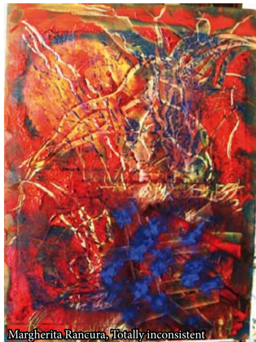
Margherita Rancura, Totally inconsistent